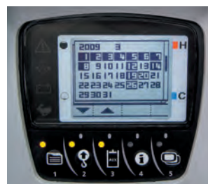
Zapis historii operacji