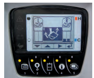
Ustawienie maksymalnego przepływu oleju